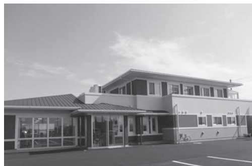
1階は大学付属クリニック、ステーションは2階です