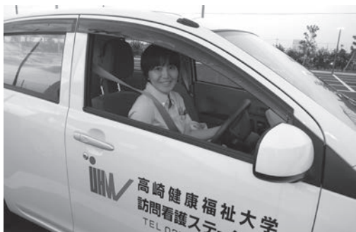
今日も「群馬のからっ風」のなかを訪問します